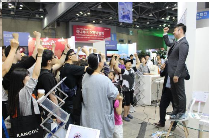
<クイズイベントの様子>