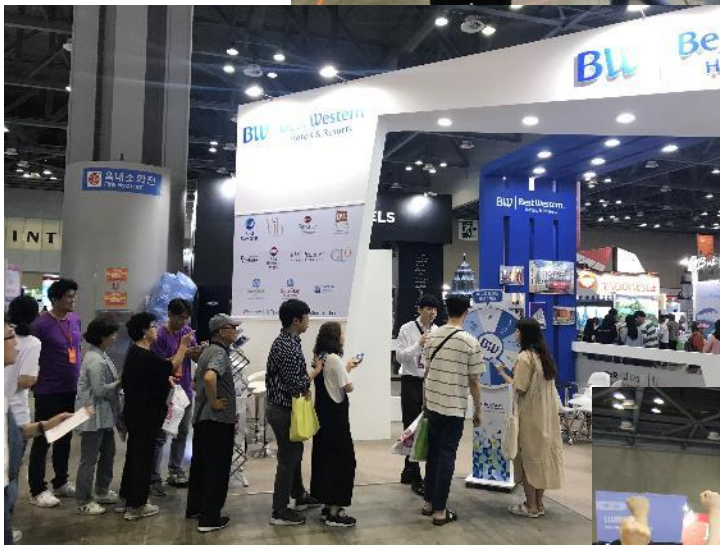
<ルーレットイベントの様子>